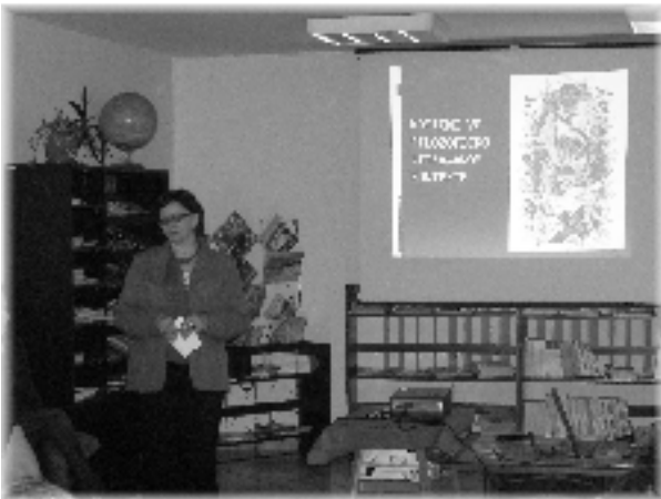
Komično vo filozoficko - literárnom kontexte