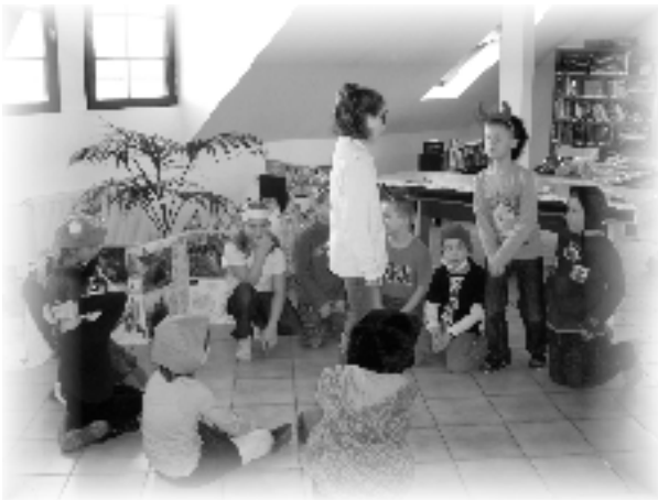
Kníhtlačiarik po stopách Dávida Gutgesela súťaž pre šikovné deti