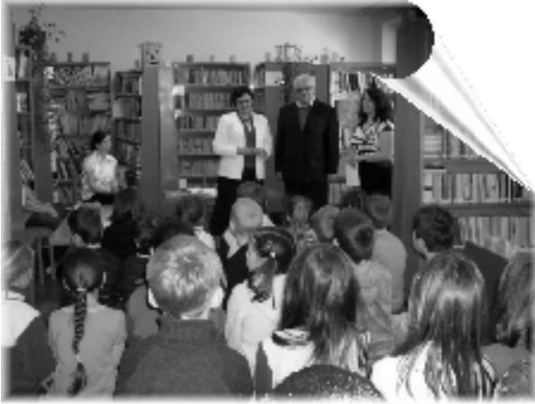
Čítajme si ....., najpočetnejší detský čitateľský maratón