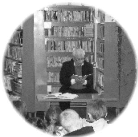
Čítajme si ....., najpočetnejší detský čitateľský maratón