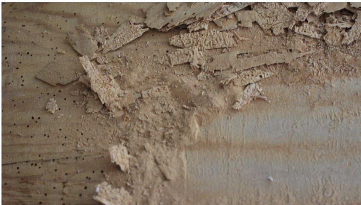
odstránenie rôznych podložiek a prelepov

Preto bude možné pristúpiť k odstráneniu, sek. Podložky, depozitného prachu, laku, a iných nečistôt, je potrebné, stabilizovať podložku, pomocou nového plátna s podrámom a doplnenie farebnej vrstvy.