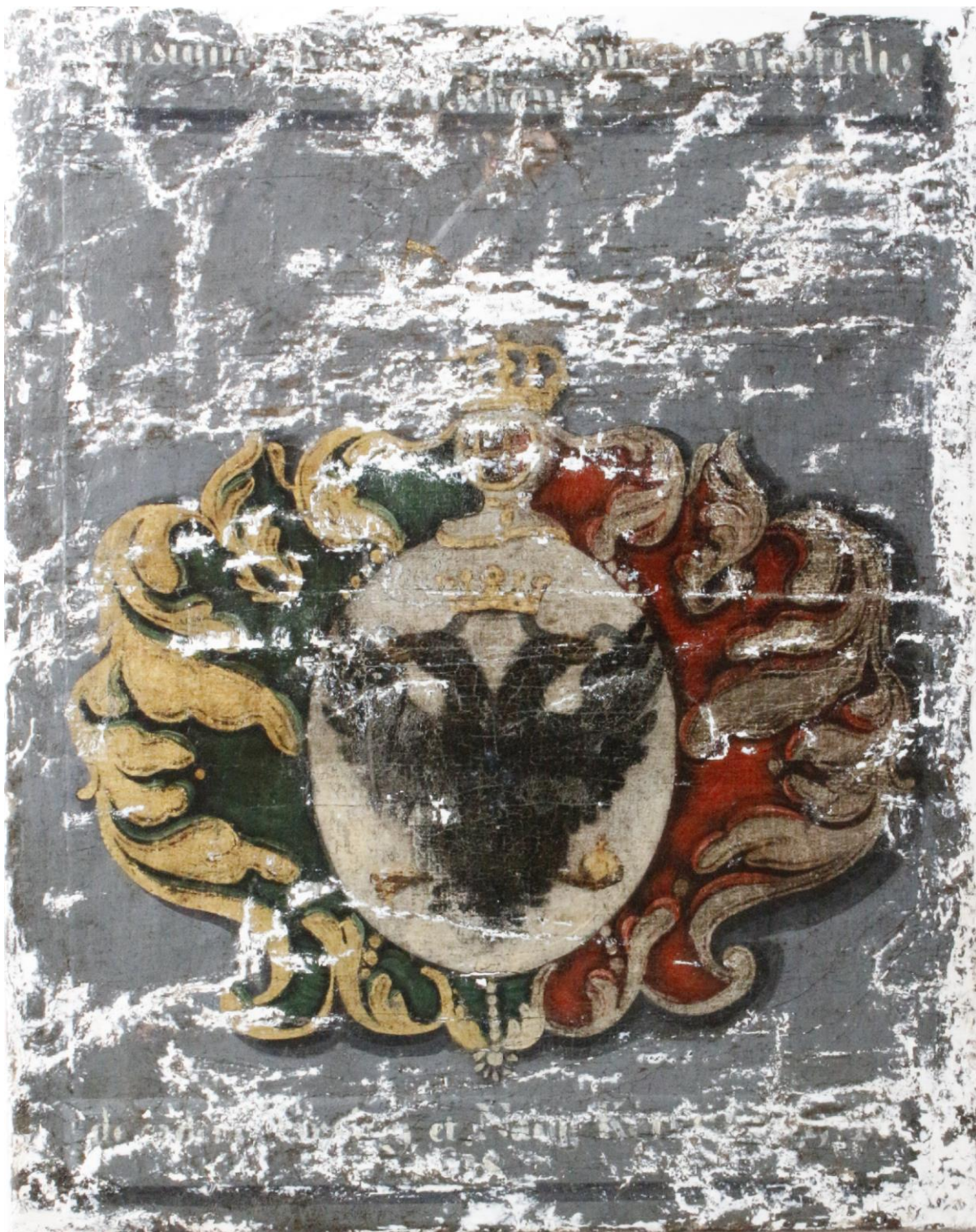
proces reštaurovania tmelenie