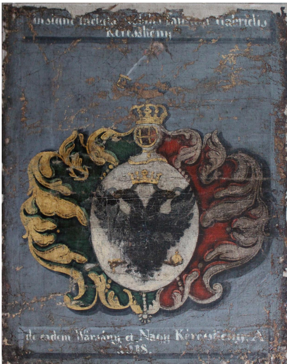
po vyčistení a na dublovaní na nové plátno