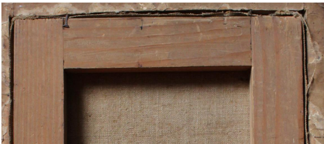
pred reštaurovaním – zadná strana

Obraz je namaľovaný na plátne. Plátno je natiahnuté na podrám bez profilácie.