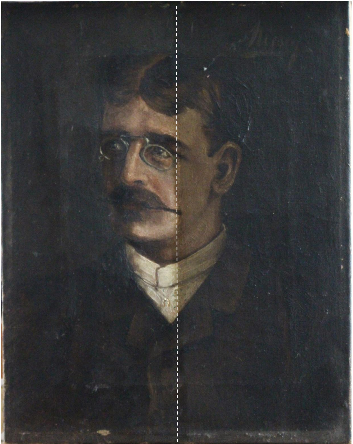
proces reštaurovania pol. čistenie