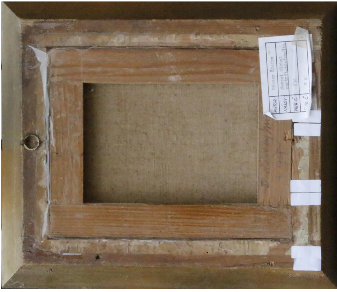
pred reštaurovaním zadná strana