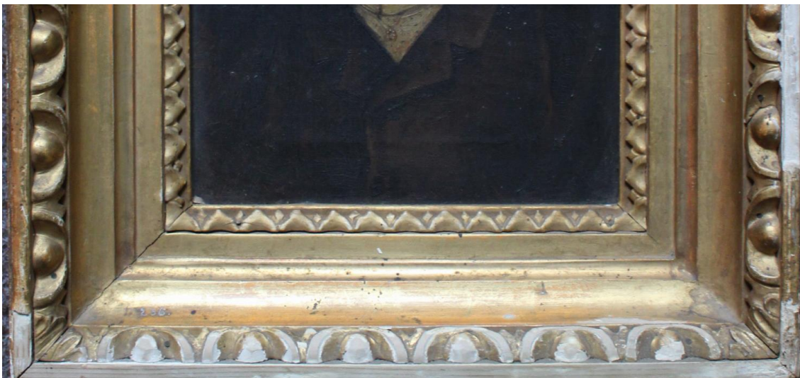
pred reštaurovaním detail poškodenia

Rám je pozlátený- metalyické, ozdobený geometrické tvary. Poškodenie rámu- obitý, ošúchaný,vypadané časti ornamentov, bočných častí rámu, na povrchu sa nachádza depozitný prach.