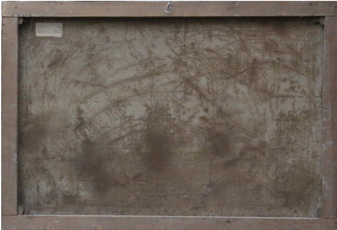
pred reštaurovaním – zadná strana

Obraz je namaľovaný na plátne. Plátno je natiahnuté na podrám bez profilácie.