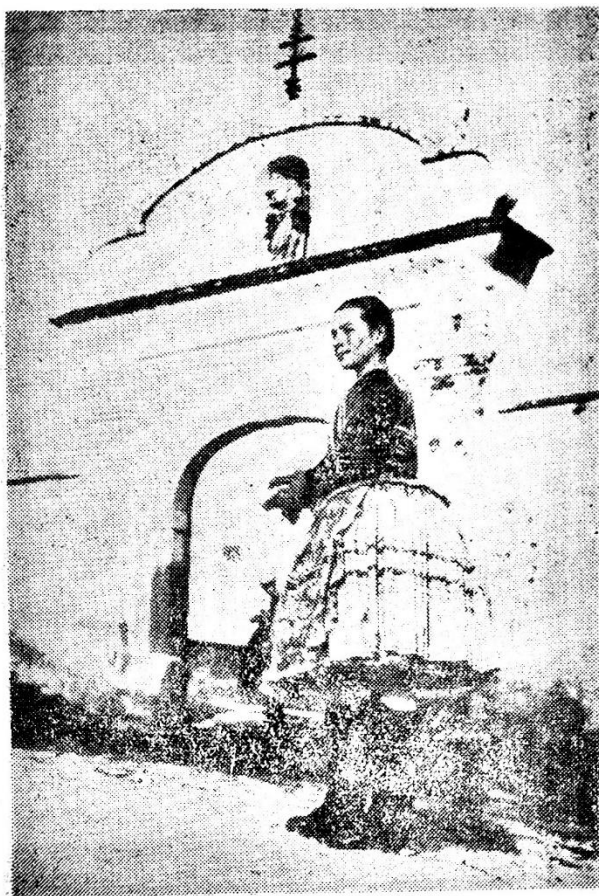
Dievka v súčasnom sviatočnom odevu (Foto: F. Hideg, r. 1948)

V zime nosili čierny súkenný odev, podšitý bielym flanelom. Keďže tento odev bol drahý a muži mali len jeden, nosili ho na všedný deň obrátený na bielu stranu a vo sviatok naopak. K súkennému ako aj k letnému odevu nosili „lajblík“ ozdobne šnurovaný a tromi radmi gombíkov vyzdobený. K súkennému odevu sa nosili čizmy, do práce bagance.