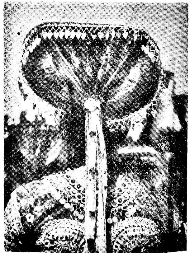
Súčasný „rohátý čepiec“ mladých žien

Tienistou stránkou prenikania tovarenských materiálov je, že rušivo zasiahli do farebnosti, ozdobnosti a čiastočne ovplyvnili aj strih. Tento rýchly proces nestačia esteticky zvládnuť a tak rozklad