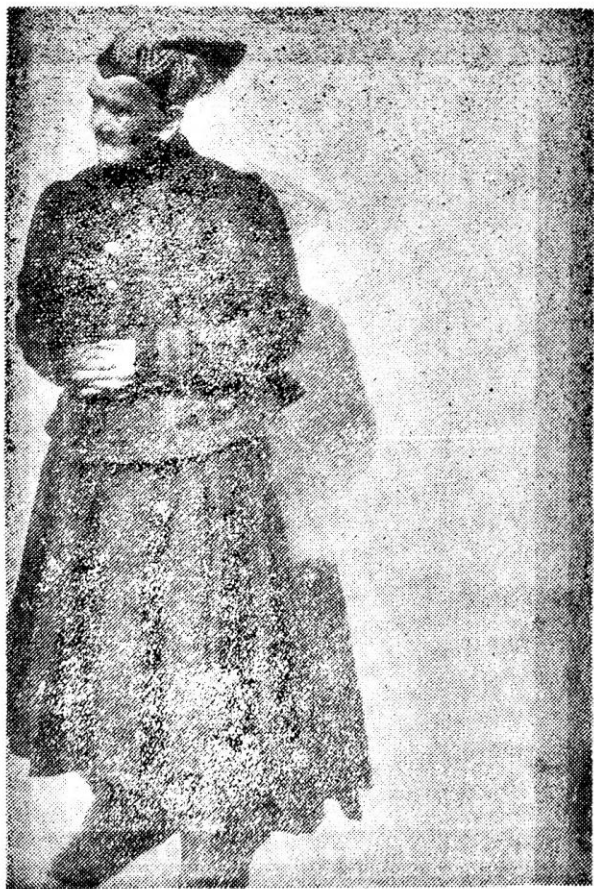
Zimný sviatočný odev žien z konca 19. storočia — rekonštrukcia —

V druhej polovici 19. storočia pôda patrila uhorským magnátom a miestnym boháčom, preto chu-