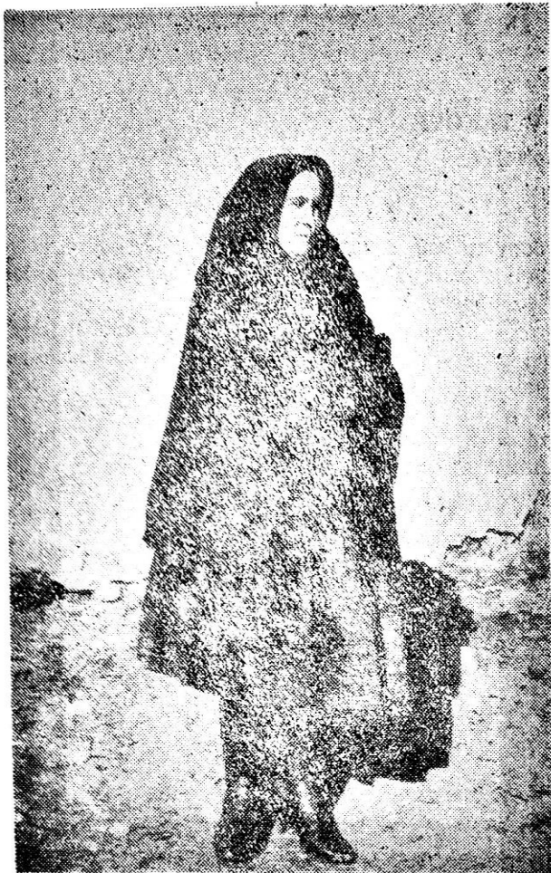
Súčasný zimný odev žien (r. 1948)

kartúnovej kvetovanej sukne, bohato do širokého pásu riasenej, ďalej zástery z toho istého materiálu a kvetovaného živôtika — „pručlíka“. Na chladnejšie dni si obliekajú ešte kvetovaný kabátik „lipitku“ a sveter. Keď idú do mesta, obliekajú si ešte kožušinový živôtik (imitácia tigroviny).