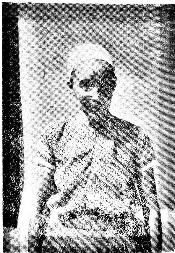
Súčasný pracovný odev žien (Foto Paul, r. 1950)

Pracovný odev od sviatočného sa podstatne nelíšil. Na všedné dni sa nosili obnosené sviatočné