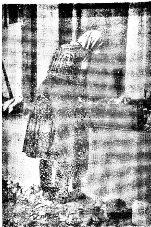
Súčasný pracovný odev žien

Ako vrchný odev im slúžili v zime do práce haleny a „medové kožuchy“. Za bývalej ČSR sa začali nosiť trištvrtové kabáty s dvojitým zapínaním, podšité vatelínom. Hlavu si pokrývali klobúkom „širákom“ s dvojitou strechou vysunutou hore a v zime baranicou. Mládencom za klobúkom nesmelo chýbať „pero“ ako znak mládenectva.