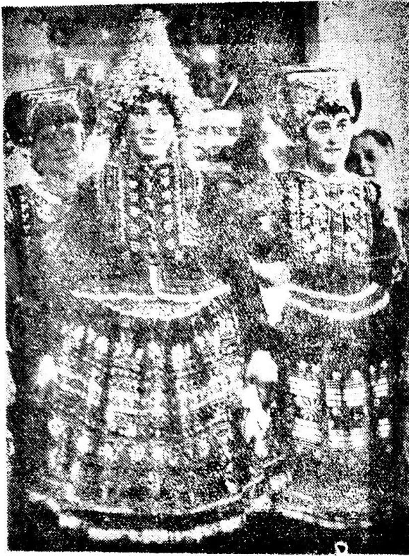
Nevesta v súčasnom svadobnom odevu s partou na hlave (Foto: F. Hideg, r. 1948)

nú modrotlač s vysokým leskom fialovočiernej farby niekedy až úplne čiernej. Prvej hovoria „farbičková“ (pretože púšťa farbu), druhej zásterová, alebo vodová, pretože sa z nich šili ženské a mužské zástere. Zásterová farbiarčina mala vysoký lesk, čo farbiari dosiahli tým, že pred mangľovaním látku naškrobili a do škrobu nastrúhali stearín a loj. Týmto sa pri mangľovaní plátno vyleštilo len na roztečených lojových vlnách a pásoch, čo pôsobí dojmom moiré, alebo akoby po ňom tiekla voda (z toho „vodavou“). Smútočný odev bol zhotovený z farbiarčiny s bronzovým nádychom. Šili sa z nej aj detské sukničky, čelenky čepcov, kabátiky, ži-vôtiky a šatky na hrdlo.