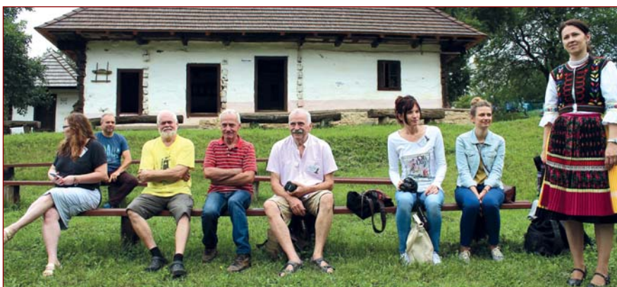
Medzinárodný výtvarný plenér INSITA