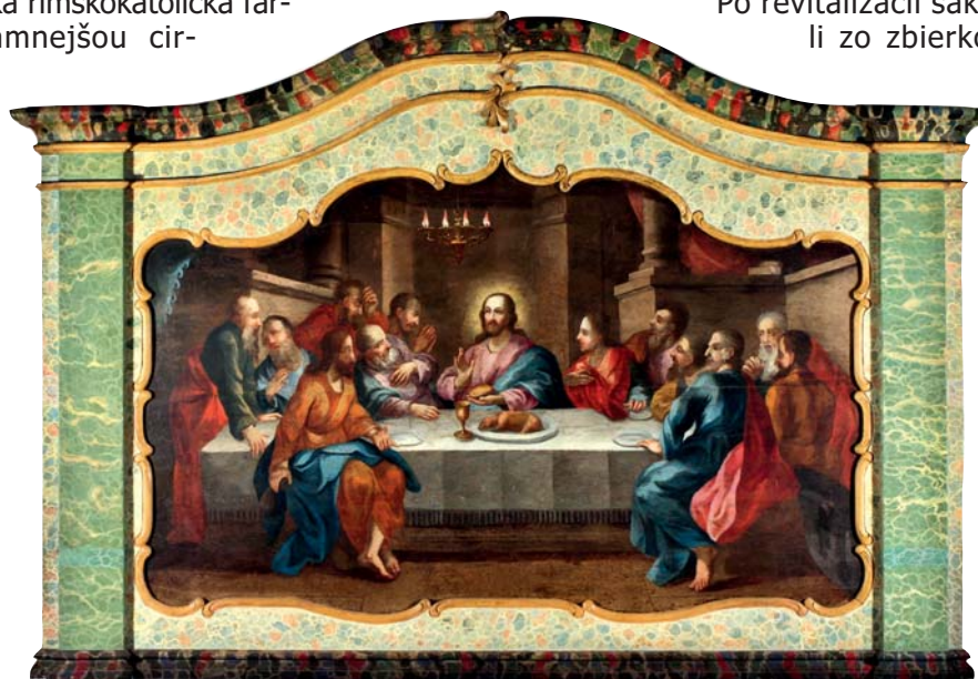
Oltárny obraz Posledná večera, 1770

Po revitalizácii sakrálnej expozície tu boli zo zbierkového fondu Vihorlatského múzea umiestnené nové zbierkové predmety, obrazy, ornáty, plastiky a dobové liturgické knihy, ktoré korešpondovali s už vystavenými exponátmi. V súčasnosti sa v sakrálnej expozícii nachádzajú umelecké diela prevažne z 18. a 19. storočia. V kaštieľskej kaplnke si návštevníci môžu pozrieť vzácny oltárny obraz Posledná večera z roku 1770, plastiky sv. Floriána, sv. Rocha a sv. Jána Nepomuckého, ktoré pochádzajú z Rímskokatolíckeho kostola v Jankovciach. Medzi cenné zbierky sakrálneho umenia patrí mala drevená plastika Kristus – Resurrexit z Lukačoviec.