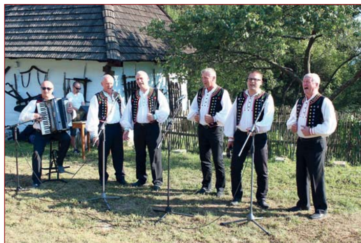
Stretnutie rodákov v skanzene