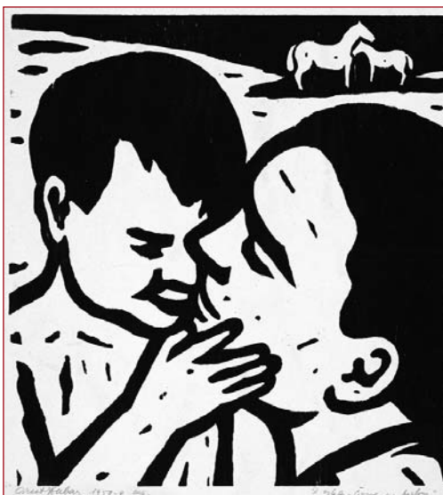
IX. Život/Materstvo, drevorez, 1959

grafického, archeologického a historického charakteru. V roku 2018 išlo o šesťnásť výstav z celkového počtu dvadsaťjeden výstavných projektov. Návštevníkom múzeum predstavilo vlastné múzejno-výstavné projekty, výstavy putovného charakteru i zapožičané prezentácie. Galerijné oddelenie sa pravidelne podieľa na príprave a propagácii výtvarných súťaží a projektov národného i medzinárodného charakteru (napr. Výtvarné spektrum, Fotosalón FIAP, Karpatské bienále grafiky detí a mládeže, Lidice a podobne), ktorých výstavné prezentácie sú ponúkané vo výstavných priestoroch.