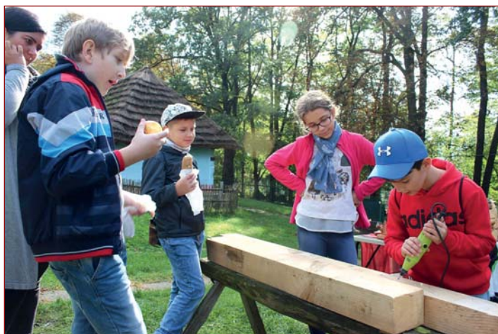
Deň tradičných remesiel pre školy