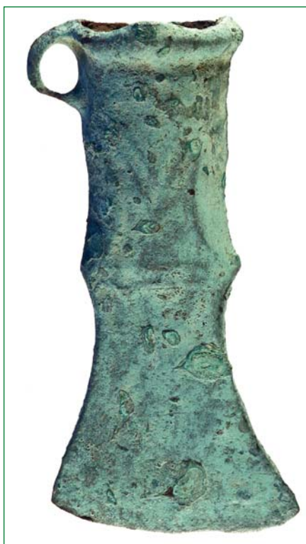
Bronzová sekerka (Humenné, 1200 p.Kr.)

N álezy z novšieho obdobia dejín boli objavené počas nedávneho archeologického výskumu lokality kaštieľa. V zásype stredovekej studne boli nájdené zlomky kachlíc, porcelánu, sklenených flakónov, železného stavebného kovania a mramorovej dosky toaletného stolíka. Nálezy pochádzajú z obdobia 19. a 20. storočia a svedčia o používaní studne v tomto období. Ďalší výskum na vonkajšom obvode budovy preukázal existenciu