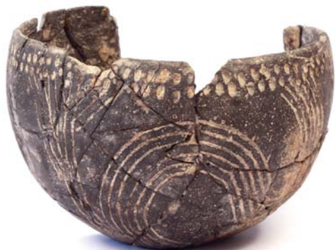
Polgulovitá nádoba bukovohorskej kultúry (Humenné)

H ornatá oblasť severovýchodného cípu Slovenska nebola nikdy ľudoprázdna. Svedčia o tom náhodné nálezy, ako aj výsledky archeologických prieskumov a systematických výskumov. V zbierkach Vihorlatského múzea sa nachádzajú najstaršie nájdené artefakty dokladujúce históriu pravekého osídlenia od 250 tisíc rokov pred Kristom po súčasné dejiny. Terajšia archeologická pozornosť je venovaná hradom Jasenov a Brekov a v rámci rekonštrukcie kaštieľa aj tomuto objektu. Nálezy opísané v tomto príspevku a mnoho ďalších nájdú návštevníci na výstave, ktorá predstavuje výsledky práce archeológov na území horného Zemplína.