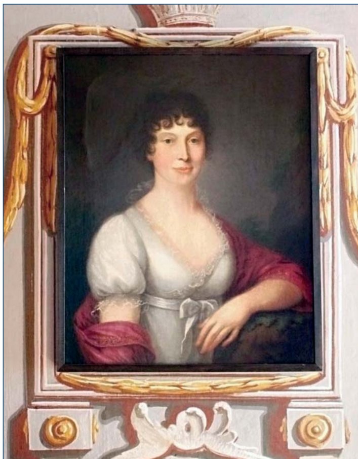
Grófica Tekla Czindery Döry (19. stor.)

Umelecko-historickú expozíciu Vihorlatského múzea dopĺňajú aj vzácne obrazové zbierky, medzi ktorými sa nachádzajú historické portréty mnohých známych osobností dejín. Každý portrét, okrem svojej umeleckej a historickej hodnoty, sa prihovára svojim jedinečným príbehom a je zaujímavou kronikou zachytených osudov svojej doby.