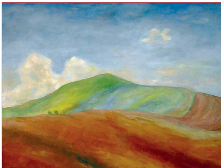
Mraky a dva stromy, olej na kartóne, 1979