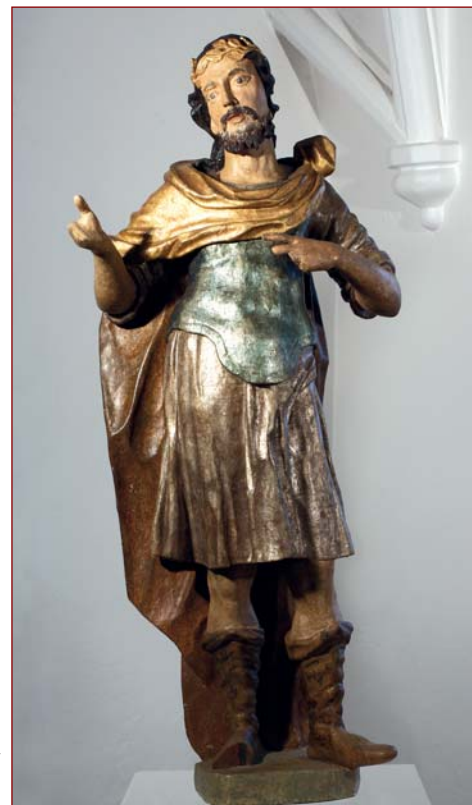
Sv. Rochus, 2. polovica 18. storočia

V decembri tohto roku si Vihorlatské múzeum v Humennom pripomenie desiate výročie sprístupnenia zrekonštruovanej kaštieľskej kaplnky, ktorá bola vo svojich pôvodných priestoroch obnovená ako súčasť sakrálnej expozície Vihorlatského múzea. Od ranného stredoveku po 20. storočie bola kaplnka neodmysliteľnou súčasťou stavieb šľachtických sídiel. V písomných prameňoch je kaštieľska kaplnka v Humennom prvýkrát uvádzaná v súpise z roku 1654. Zo spomínaného súpisu sa dozvedáme o inventári v kaštieľskej kaplnke, ktorý tvorili dva obrusy, dva drevené svietniky, dve konvičky, osem maľovaných stoličiek a oltár s obrazom Blahoslavenej Panny Márie s nápisom Patrona Hungariae. Práve Pannu Máriu, patrónku Uhorska bola kaplnka v kaštieli zasvätená. Takéto patrocínium nemal žiadny iný kostol na území Humenného.