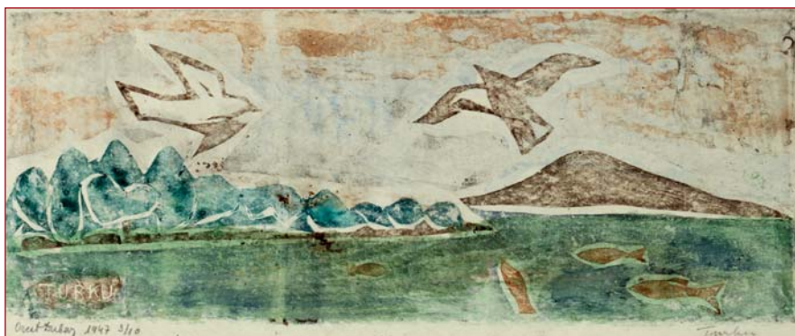
Turku, drevorez, 1947

Z mnohých dosiahnutých úspechov si osobitne vážil uznanie z mekky umenia – Talianska. Stal sa čestným členom Accademia Fiorentina delle arti (1964) a čestným členom Accademia internazionale Tommaso Campanella v Ríme (1972), kde bola jeho tvorba ocenená diplomom a zlatou medailou. V roku 1969 mu bol udelený titul zaslúžilý umelec a v roku 1977 čestný titul národný umelec. Za svoju prácu získal množstvo ocenení, medzi ktorými sú zvlášť významné 1. cena v súťaži k 10. výročiu SNP (1954), strieborná medaila v súťaži Mier svetu v Lipsku (1959), 1. cena v súťaži k 15. výročiu oslobodenia ČSR (1960), Veľká cena na Bienále grafiky v Banskej Bystrici (1977), cena Ex aequo súčasnej slovenskej grafiky v Banskej Bystrici (1981), atď.