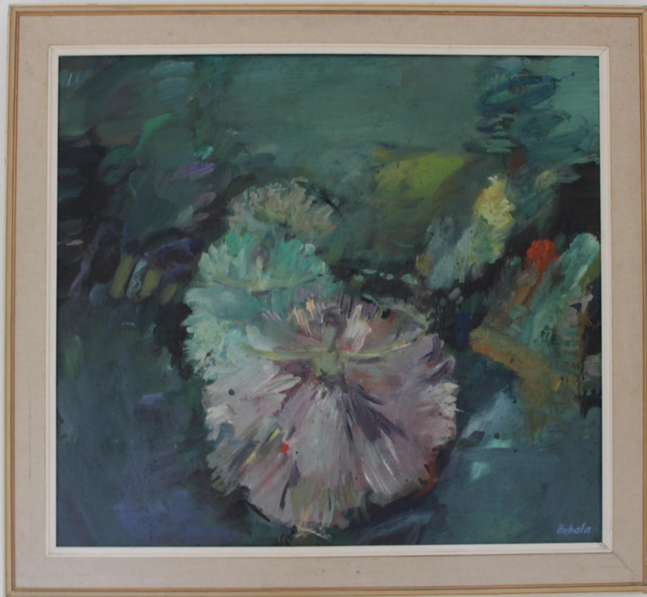
Michal Čabala: Balet, 1969. Šarišská galéria v Prešove

Výstava diel akad. mal. Michala Čabalu vo Vihorlatskom múzeu v Humennom, 2016.