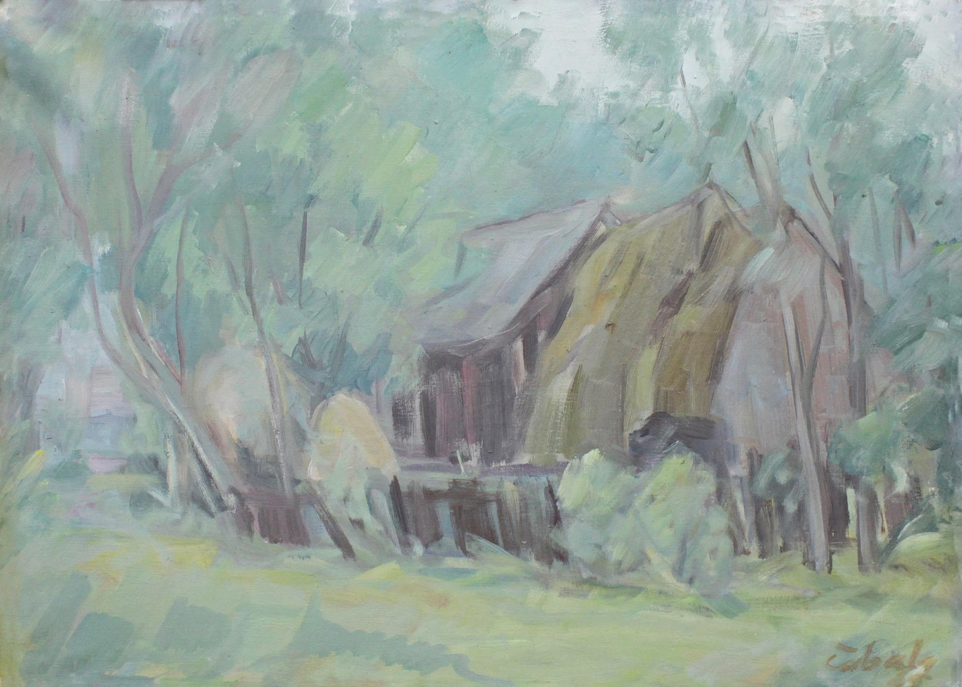
Michal Čabala: Stodola II, 80. roky 20. storočia. Vihorlatské múzeum v Humennom