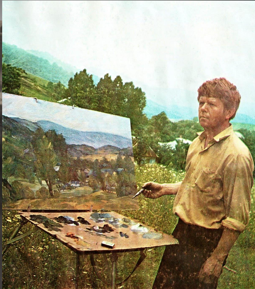
Archív Vihorlatského múzea v Humennom